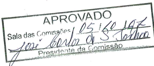
Relator: Geraldo Alves Cordeiro